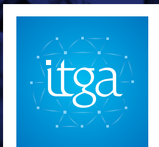
POLLUANTS DU BÂTIMENT