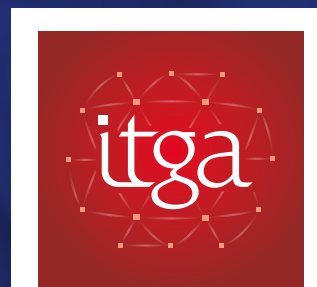
HYGIÈNE SANTÉ ENVIRONNEMENT